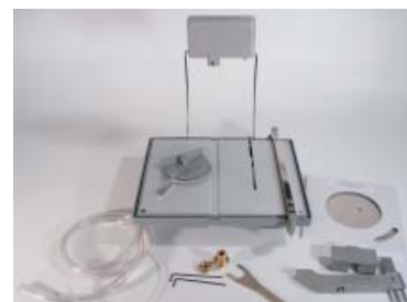
30 103 30 Kreissäge Aufsatz Trim Saw ConversionKit