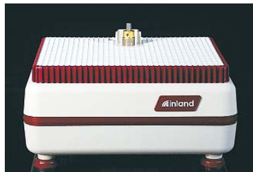
30 120 00 INLAND Contour 230 x 255 mm Arbeitsfläche (beidseitig verwendbar), 3450 U/min, Thermoschutz, 19 mm Schleifkopf

230 x 255 mm work surface (double sided), 3450 rpm, thermal protection, TouchTop switch, 19 mm bit