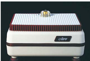
30 116 00 INLAND Aero 230 x 255 mm Arbeitsfläche (beidseitig verwendbar), 3450 U/min, Thermoschutz, TouchTop - Schalter, 19 mm Schleifkopf

230 x 255 mm work surface (double sided), 3450 rpm, thermal protection, TouchTop switch, 19 mm bit