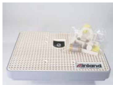
30 103 50 Schleifkopf Aufsatz Grinding ConversionKit