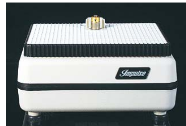
30 117 00 INLAND Impulse 230 x 255 mm Arbeitsfläche (beidseitig verwendbar), 3500 U/min, Thermoschutz, TouchTop - Schalter, 25 und 6 mm Schleifköpfe

230 x 255 mm work surface (double sided), 3450 rpm, thermal protection, 19 mm bit