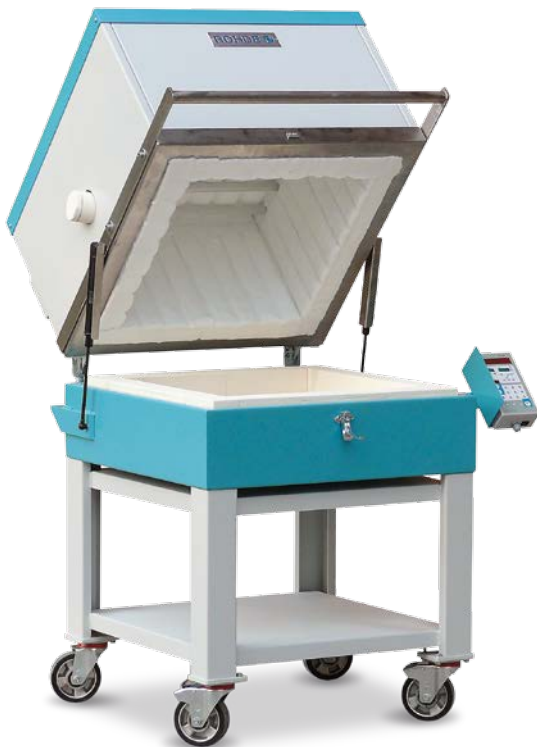
FE 100 N/S mit Untergestell (Option)