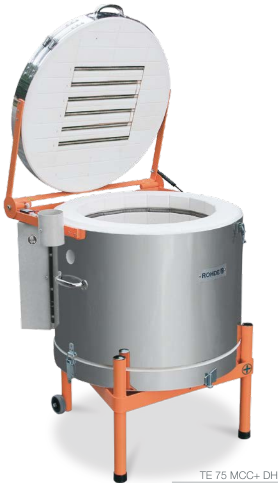
TE 75 MCC+ DH