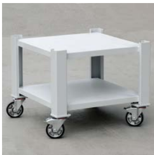
Untergestell für FE 75 und FE 100 N/S