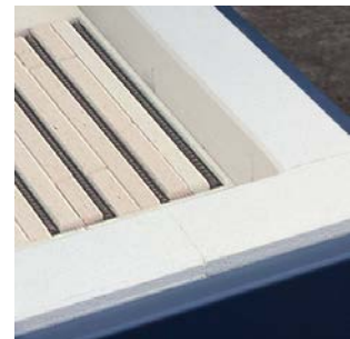
Bodenheizung für FE 250 bis FE 1800