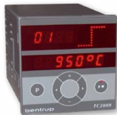
Regler TC 2088e